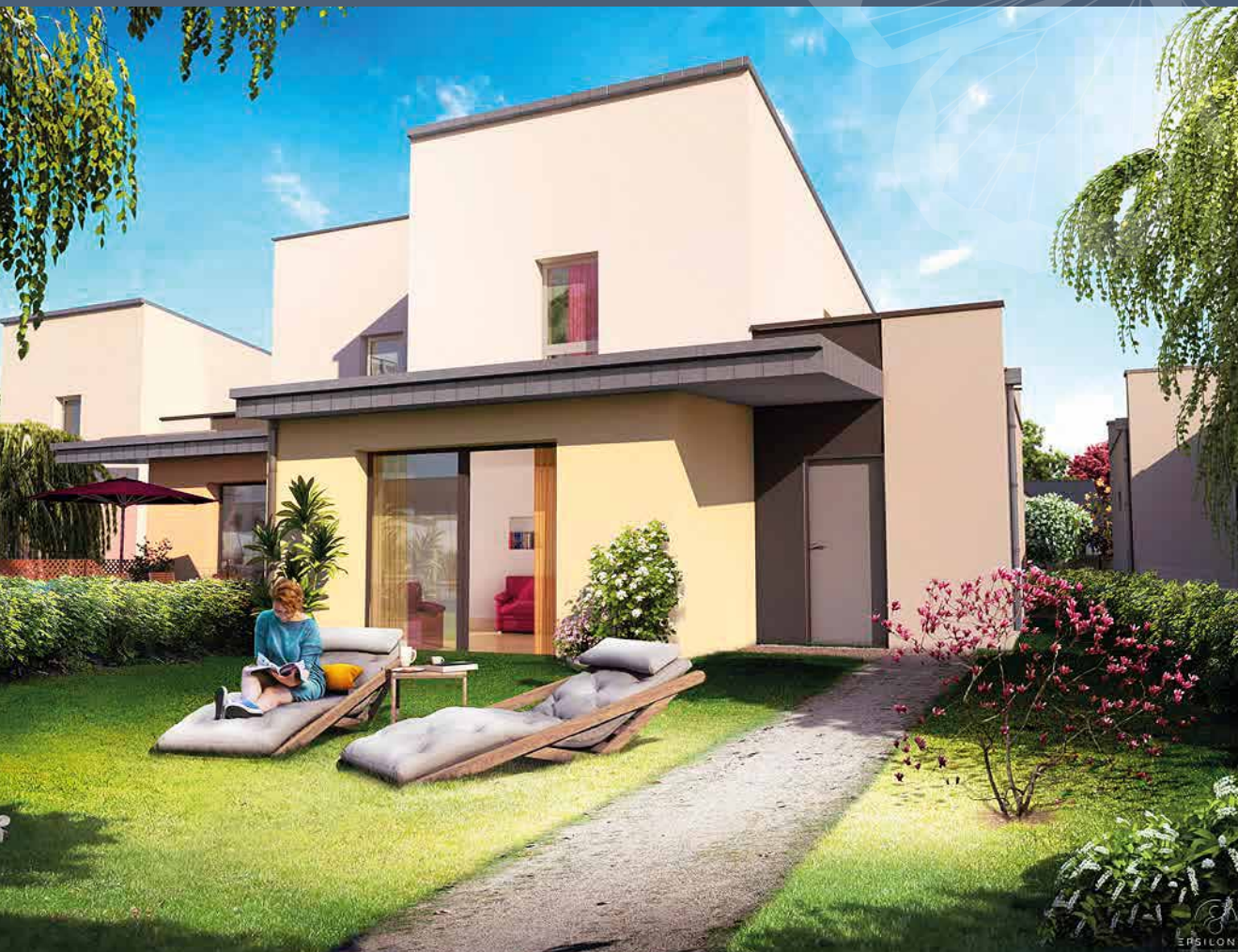
11 MAISONS T4 AVEC JARDIN